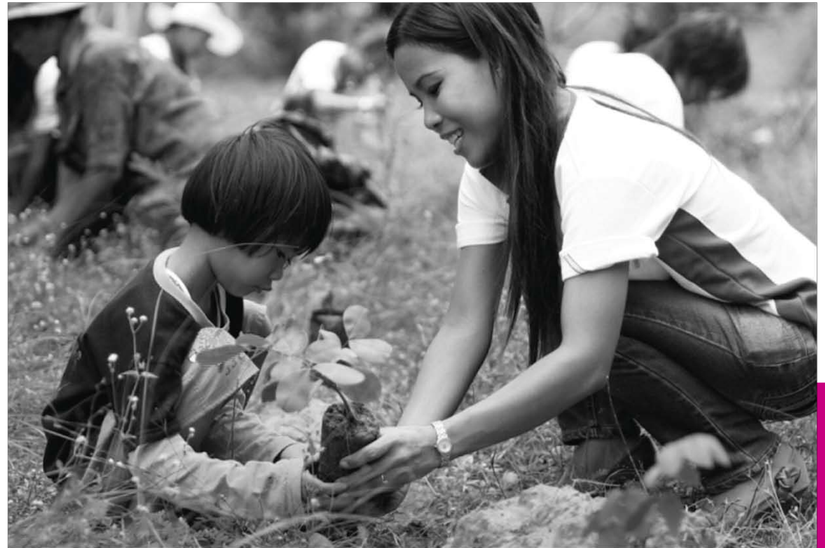
Thaïlande, Krungthai AXA Life Les collaborateurs d'AXA et les habitants de la province de Nakhon Ratchasina ont planté plus de 5 000 arbres.