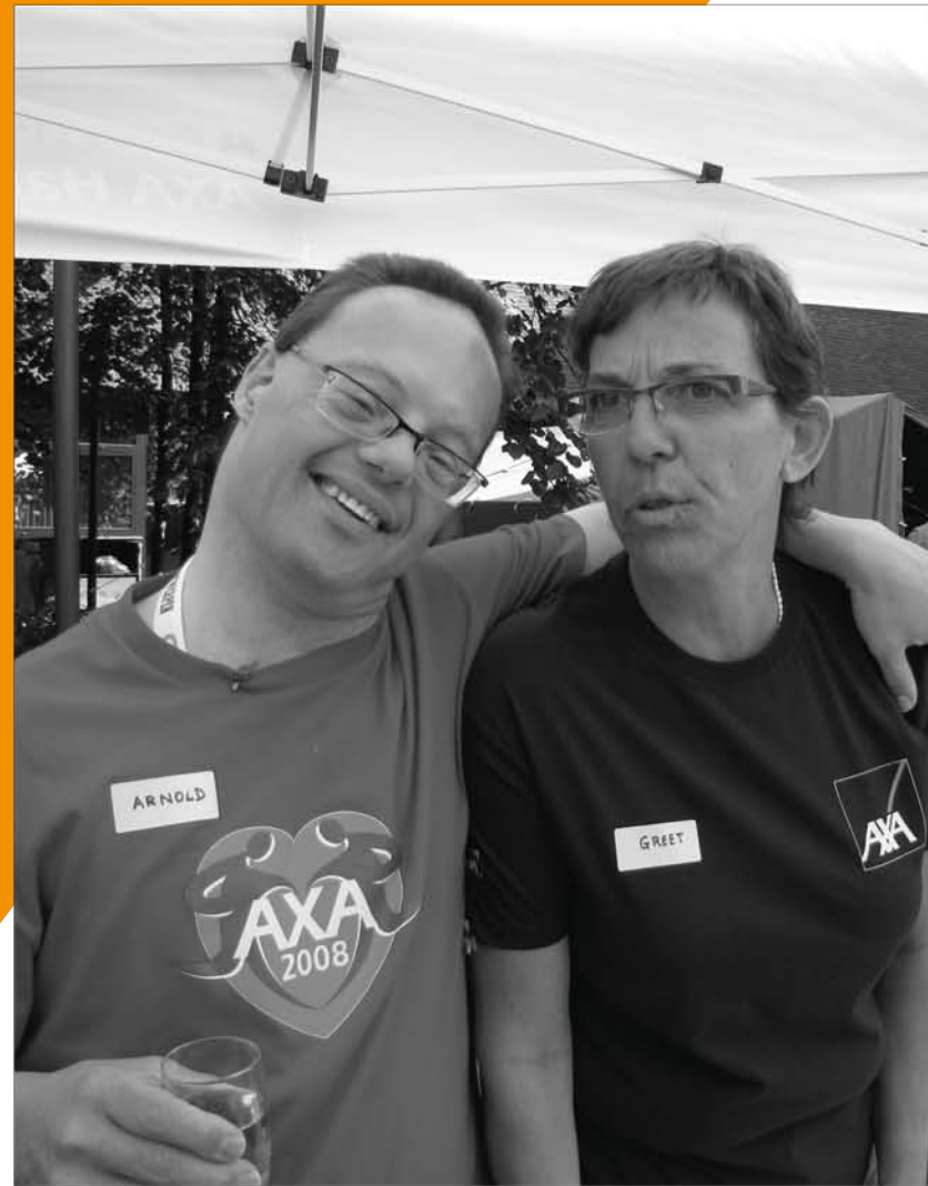
Belgique, AXA Belgique Barbeque est une fête pour les bénévoles et les associations partenaires d'AXA Atout Cœur.