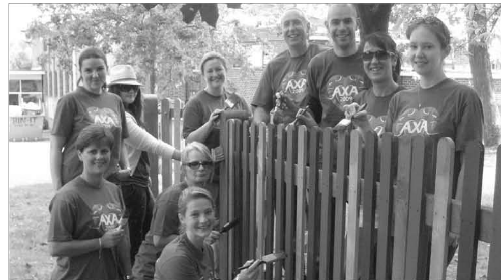
Royaume-Uni, AXA PPP Healthcare Collaborateurs du Département Relations Clients peignant la clôture d'une école primaire.