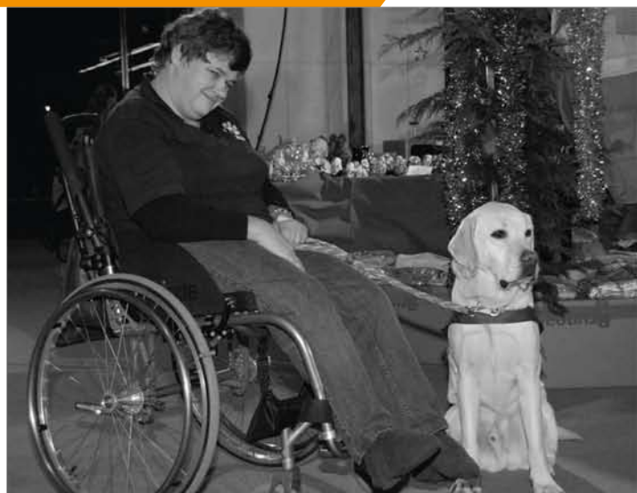
Belgique, AXA Belgique Cérémonie de passation de chiens-guide.