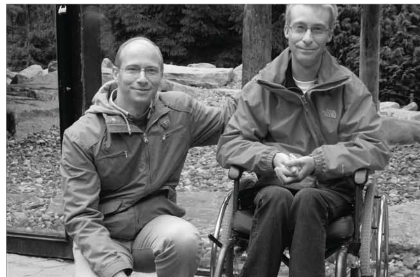
Luxembourg, AXA Luxembourg Sortie au zoo avec des adultes handicapés.