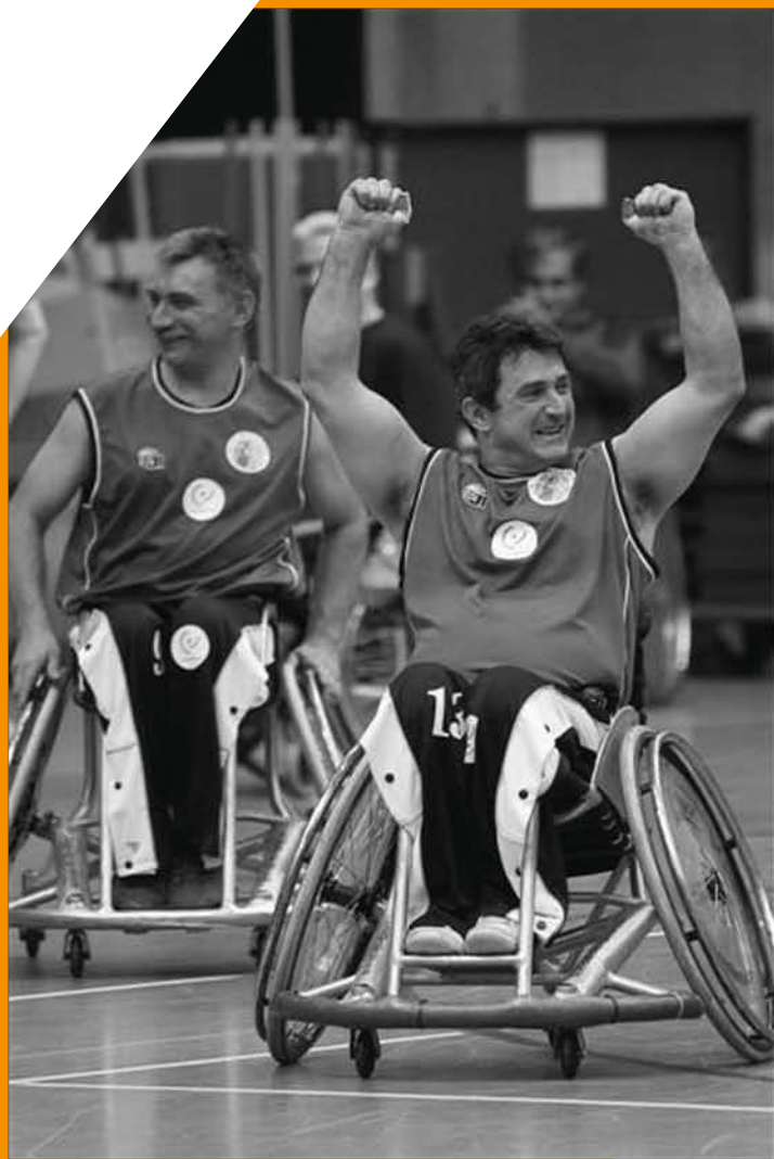
Luxembourg, AXA Luxembourg LuxRollers est un tournoi international de basket en chaise roulante.