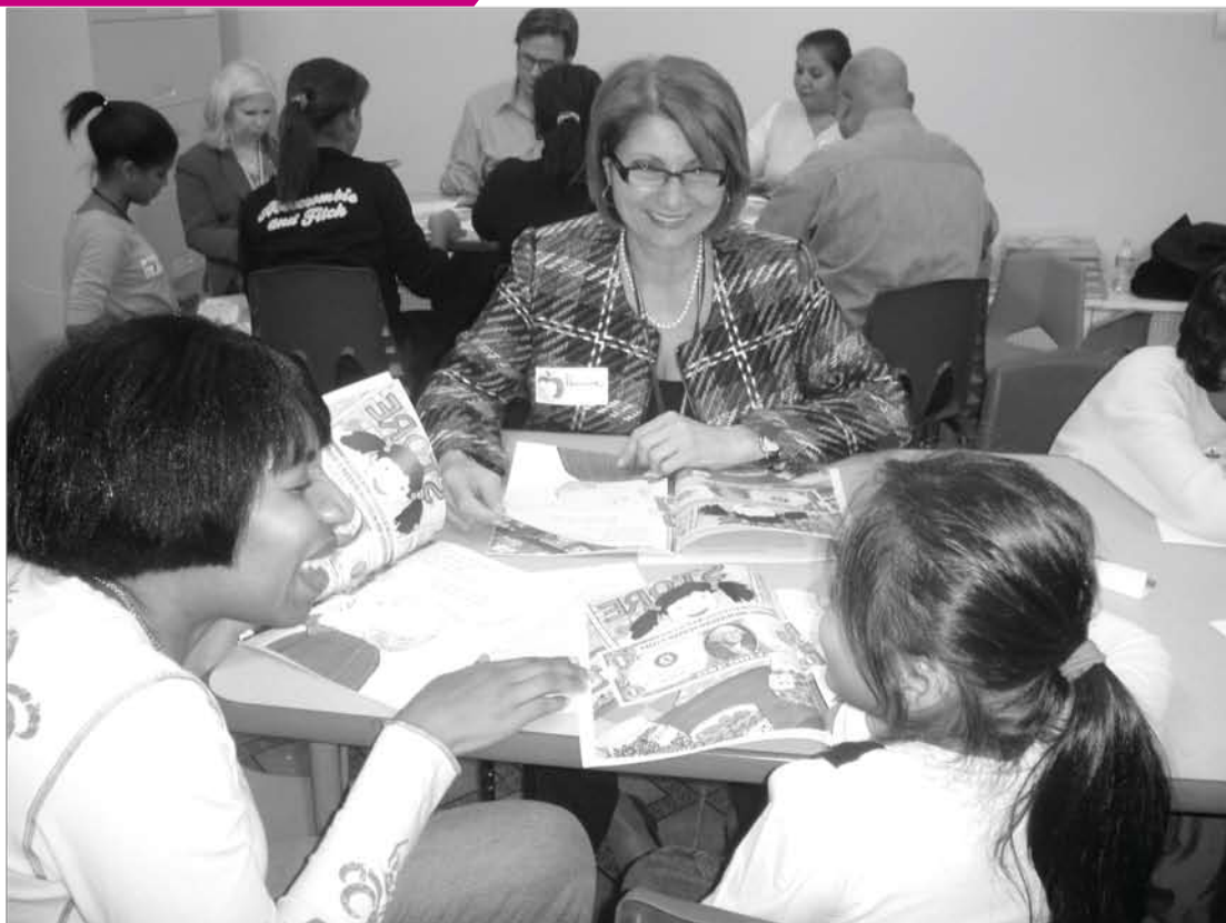
Etats-Unis, AXA Equitable Dans le cadre de l'opération "AXA Equitable Makes Cents", les bénévoles d'AXA ont lu des ouvrages d'éducation financière avec les élèves d'un centre d'accueil pour sans domiciles fixes.