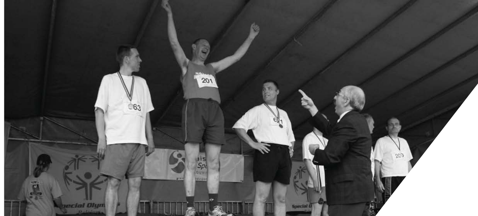
Belgique, AXA Belgique Barbeque est une fête pour les bénévoles et les associations partenaires d'AXA Atout Cœur.