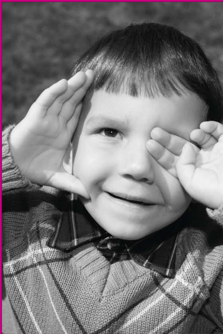
Ukraine, AXA Ukraine Les employés d'AXA ont organisé une journée de prévention routière au profit d'un orphelinat.