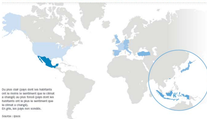
Intensité du sentiment d'un changement climatique au cours des 20 dernières années

C'est dans les pays où les chaleurs sont les plus fortes que les résultats sont les plus élevés : 78 % des Indonésiens pensent que c'est « tout à fait » le cas, tout comme 69 % des Mexicains, 63 % des Hongkongais ou encore 59 % des Turcs.